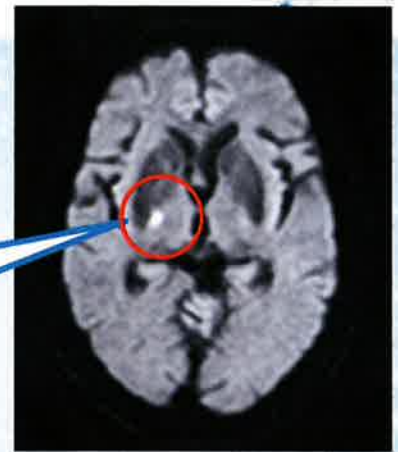
頭部MRI 拡散強調画像